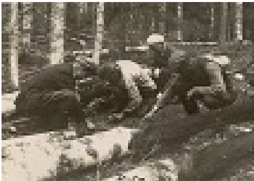
Koivupinon pohjan tutkimista