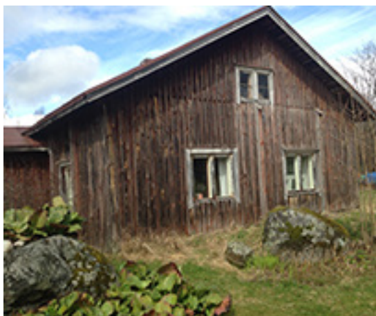
Rappumäen torppa nykyisin