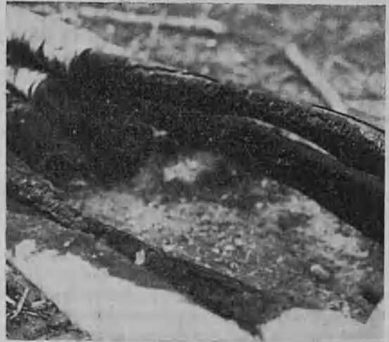
Tutkimuksen kohteena ollut rovio.